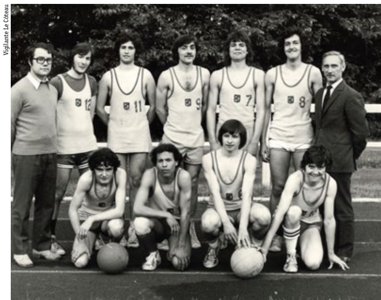
Vigilante Le Coteau

Côté bonnes nouvelles, en cette même saison 1950-51, La Vigilante achète un piano afin de ne plus devoir en louer