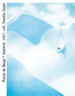
Plaisir de Neige