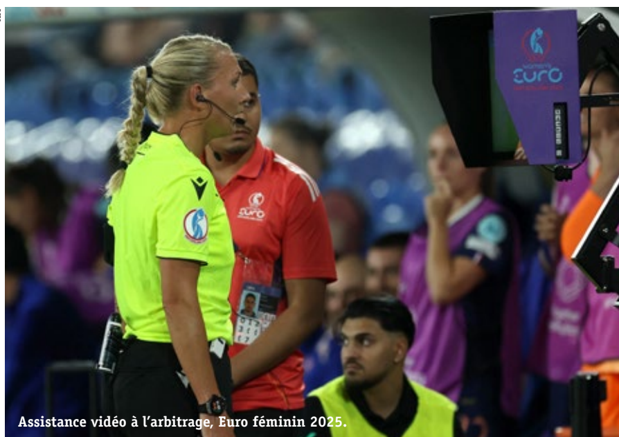
Assistance vidéo à l'arbitrage, Euro féminin 2025.

On le peut voir comme un refuge dans la mesure où il n'y a pas d'intérêt économique direct. Même s'ils touchent des primes, les joueurs ne sont pas salariés de leurs sélections. Il y a aussi un peu plus de surprises, lesquelles traduisent paradoxalement l'affaiblissement du football des nations. Les meilleures équipes alignent en effet des joueurs