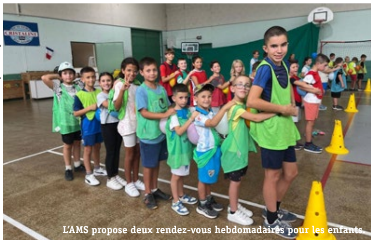
L'AMS propose deux rendez-vous hebdomadaires pour les enfants

Aujourd'hui, l'activité de l'AMS se répartit principalement entre une école multisport et des séjours de vacances sportifs. L'école multisport réunit 80 licenciés âgés de 4 à 12 ans, accueillis les mardis et jeudis de 16 h 30 à 18 h. Les séjours sportifs, eux, proposent des activités de plein air (tir à l'arc, course d'orientation, VTT...) et fédèrent 500 adhérents de 6 à 12 ans: dix en été et d'autres aux