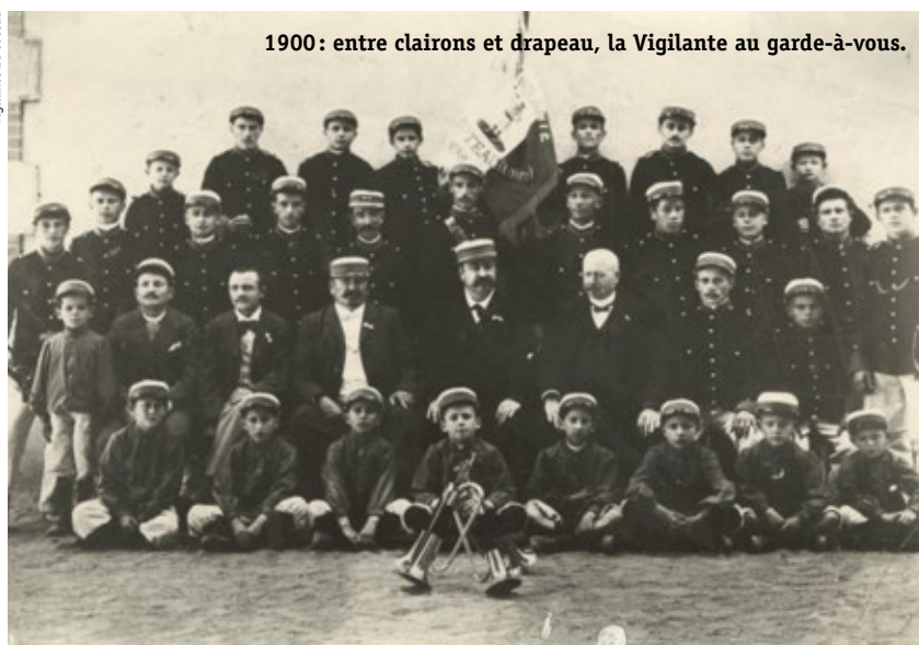
1900: entre clairons et drapeau, la Vigilante au garde-à-vous.

La plaquette éditée en 1999 pour le centenaire de l'association nous apprend aussi que La Vigilante fut créée à