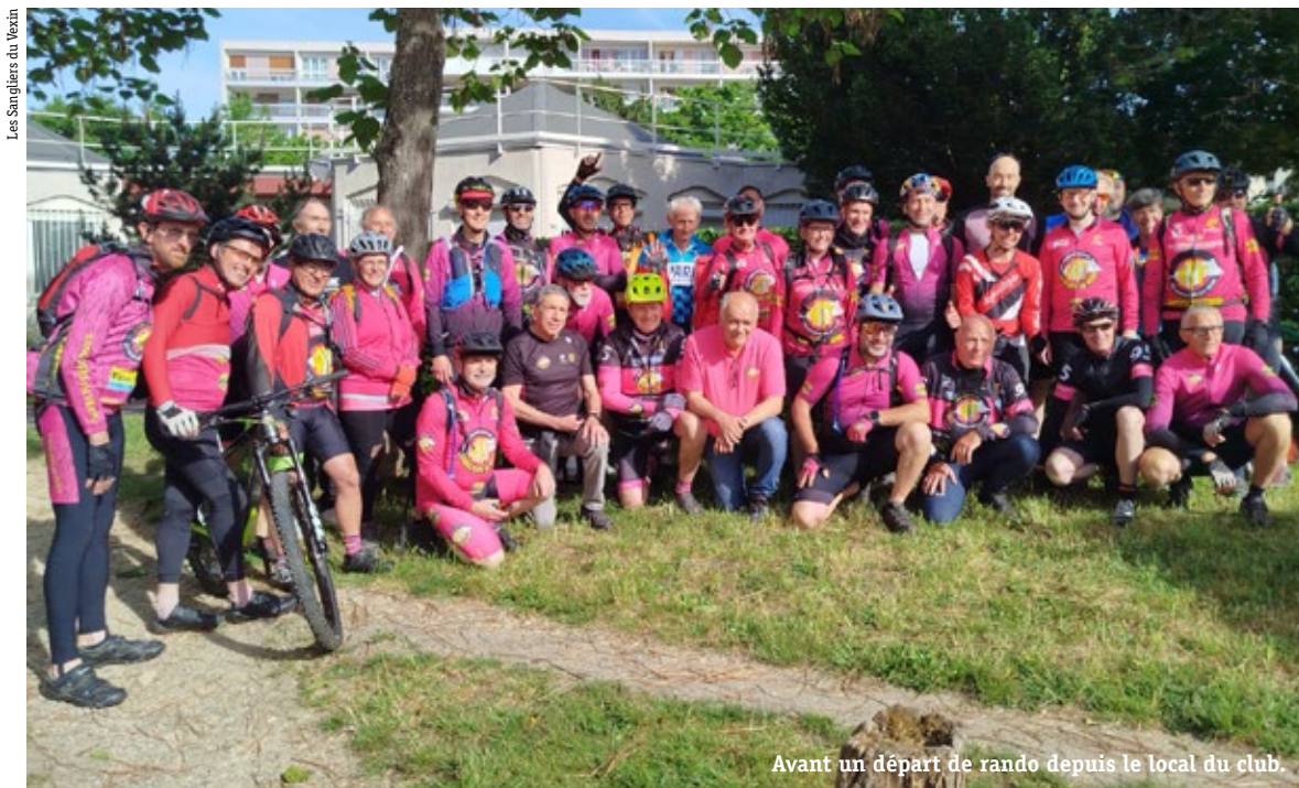
Les Sangliers du Vexin

Né en 1987 à Cergy-Pontoise, le club compte 99 licenciés et anime le VTT Ufolep en Val-d'Oise. Il peine toutefois à renouveler sa harde.