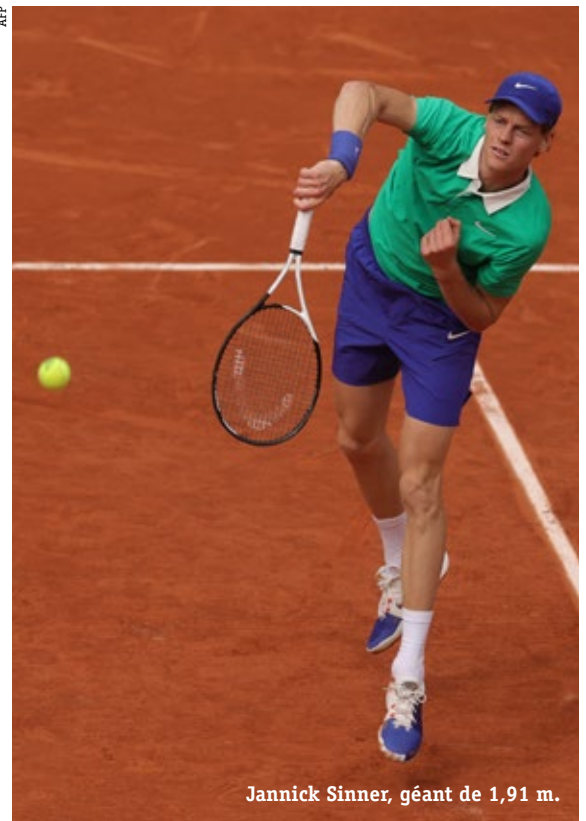
Jannick Sinner, géant de 1,91 m.