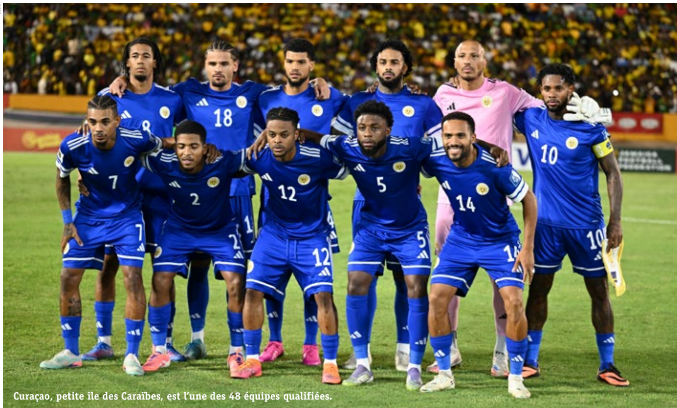
Curaçao, petite île des Caraïbes, est l'une des 48 équipes qualifiées.

Cela étant, sitôt donné le coup d'envoi de l'évènement, le 11 juin au mythique stade Azteca de Mexico – qui vit en 1970 le triomphe du Brésil de Pelé, puis en 1986 celui de l'Argentine de Maradona –, des milliards d'amateurs seront rivés à leurs écrans. Et ceux-ci seront d'autant plus nombreux que ces dernières années le spectacle du football a conquis de nouveaux contingents d'adeptes en Asie et en Amérique du Nord.