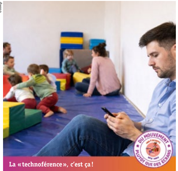
La «technoférence», c'est ça!