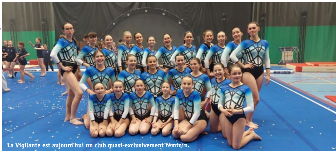
La Vigilante est aujourd'hui un club quasi-exclusivement féminin.