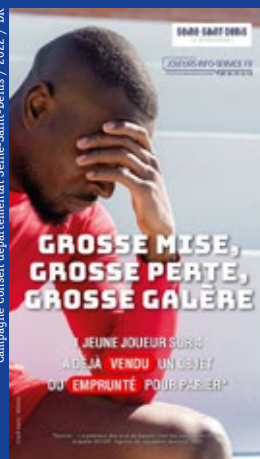
Campagne Conseil départemental Seine-Saint-Denis / 2022

Avant chaque grand match ou grande compétition fleurissent des publicités qui, depuis l'ouverture en 2010 du marché des paris en ligne en France, proposent d'ajouter à l'émotion sportive l'espoir de faire fructifier sa supposée science du jeu. Ciblent les jeunes hommes des milieux populaires, les Winamax, Betclix, Unibet et autre Bwin jouent sur l'impulsivité, l'ego ou la corde sensible, en suggérant que le parieur malin pourra aider sa famille. La réalité est tout autre : endettement et addiction. « Cette mécanique persuasive a banalisé les paris comme norme culturelle chez les jeunes générations », se désole le journaliste Abdellah Boulma dans l'ouvrage collectif Foot Manifesto . ●