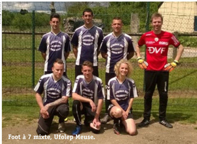
Foot à 7 mixte, Ufolep Meuse.