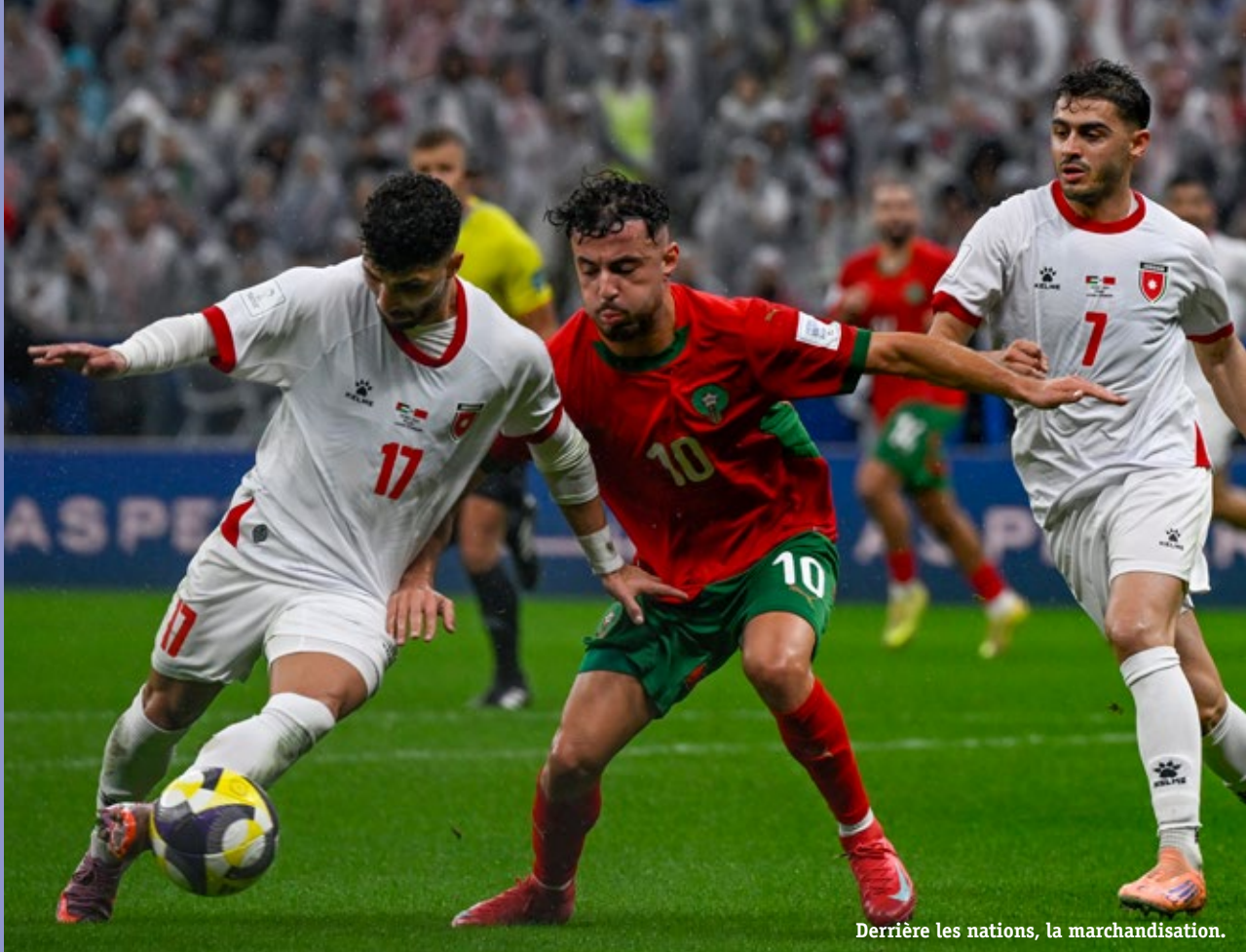
Derrière les nations, la marchandisation.