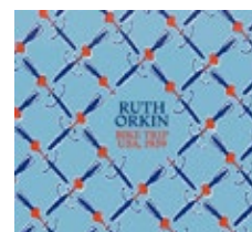
Ruth Orkin, Bike Trip, USA, 1939 , sous la direction de Clément Chéroux, Textuel, 128 pages, 45 €

La photographe Ruth Orkin (1921-1985) est surtout connue pour son American Girl in Italy (1951), où une rayonnante jeune femme aimante les regards masculins. Mais c'est sa traversée des États-Unis du Pacifique à l'Atlantique, effectuée à 17 ans avec son vélo, qu'avaient mis à l'honneur en 2024 la Fondation Henri Cartier-Bresson et l'ouvrage accompagnant l'exposition. Si elle parcourait les longues distances en voiture, en train ou en bus, Ruth Orkin visitait à bicyclette chaque ville-étape, s'attirant l'attention de la presse locale. Et souvent elle immortalisait son vélo devant des bâtiments emblématiques et des scènes de rue où elle s'essayait volontiers à des jeux de lumière. ●