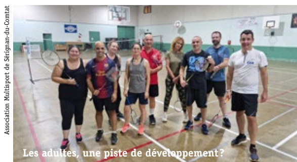
Les adultes, une piste de développement ?