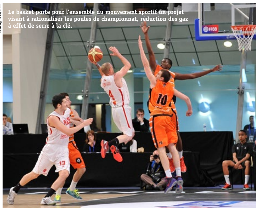
Le basket porte pour l'ensemble du mouvement sportif un projet visant à rationaliser les poules de championnat, réduction des gaz à effet de serre à la clé.

C'est là une initiative que tout autre sport individuel dont les rencontres se disputent