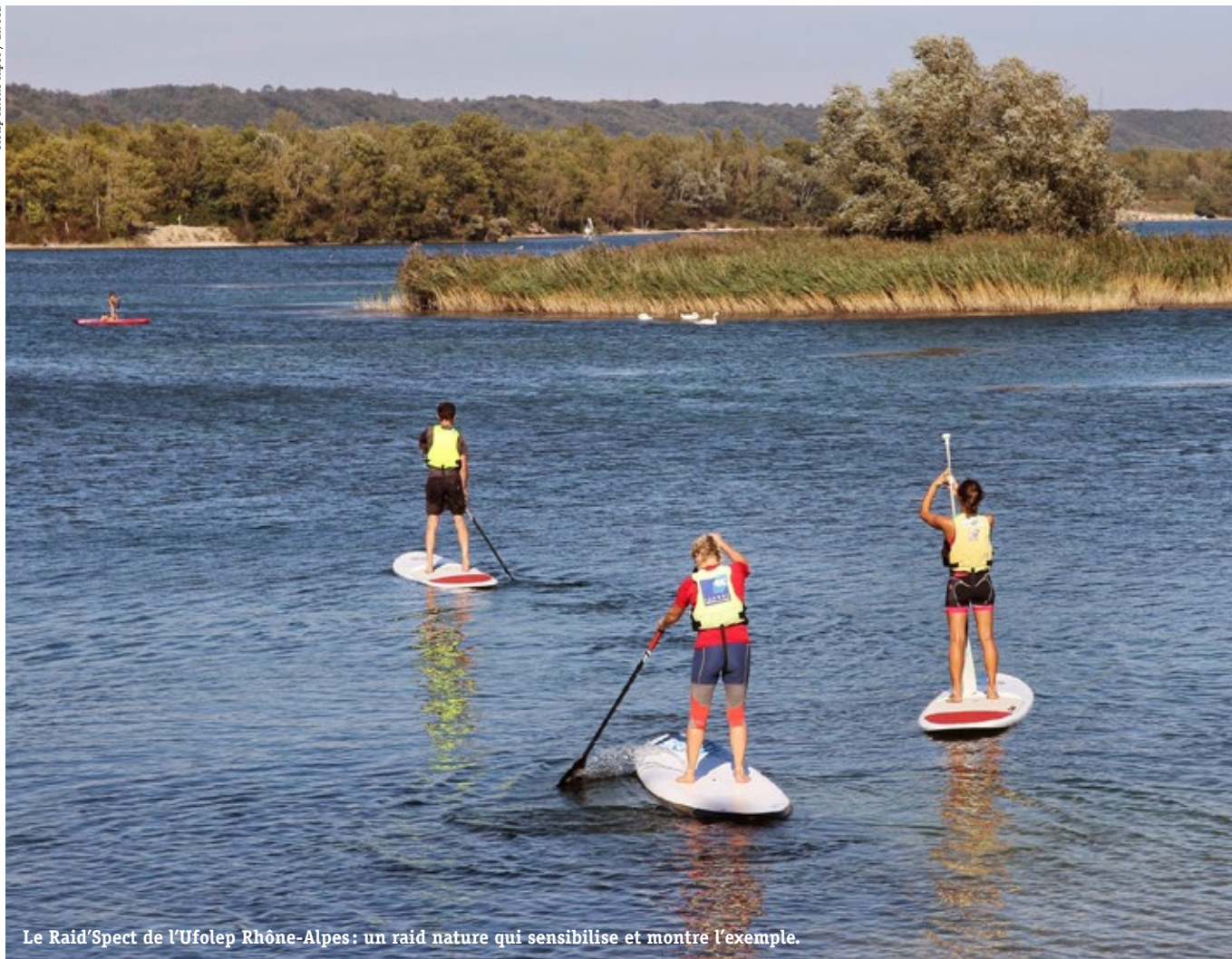
Le Raid'Spect de l'Ufolep Rhône-Alpes : un raid nature qui sensibilise et montre l'exemple.